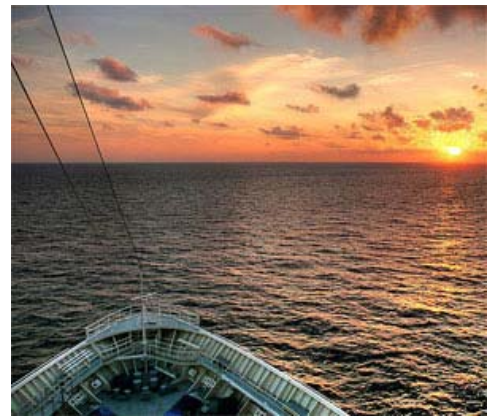
Sunrise off the bow, album di joiseyshowaa, www.flickr

Un po' lo abbiamo fatto, ma è stato evidente che una serata in compagnia di una personalità come quella di Magdi Cristiano Allam - che da sette anni vive sotto scorta (e abbiamo visto cosa